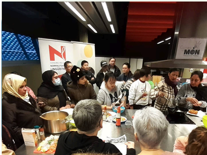
Taller de cuina i hora del te intercultural, Any Nou Xinès