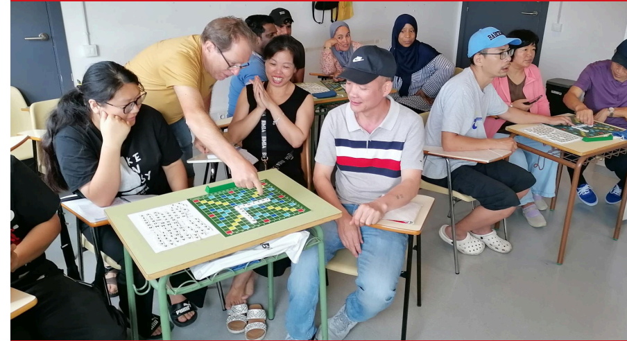
L'alumnat juga a l'Scrabble amb la Federació Internacional de Scrabble en Català

Entre les diverses activitats, cal destacar les col·laboracions durant l'Any Nou Xinès, una celebració que posa de relleu la interculturalitat que conviu a Santa Coloma i que promou la seva riquesa, alhora que fomenta l'ús de la llengua catalana entre la població colomenca.