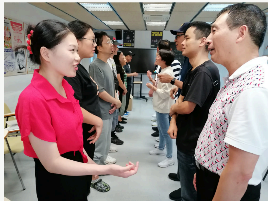
Dinàmica de conversa exprés per conèixer millor els companys i companyes