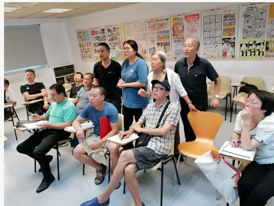
Pràctica espontània de l'alfabet durant les primeres setmanes de classe