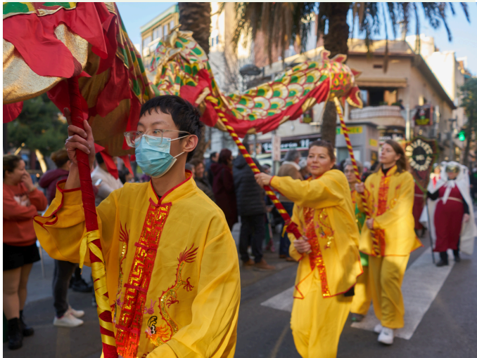
Rua de la Festa dels Fanalets, Any Nou Xinès