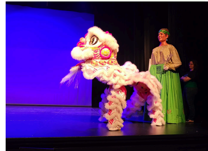
Obra de teatre De Santa Coloma a la Xina , Associació Cultural Popular Xinesa