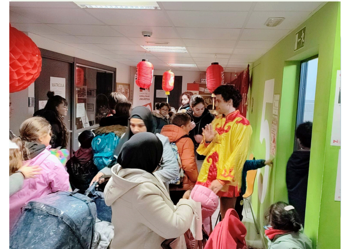
Gimcana d'entitats, Any Nou Xinès