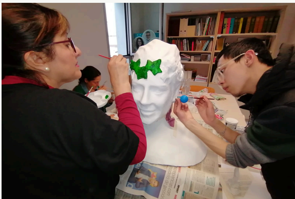
L'alumnat comença a pintar les fulles d'heura de la gegantona (Ciutat Gegantera)