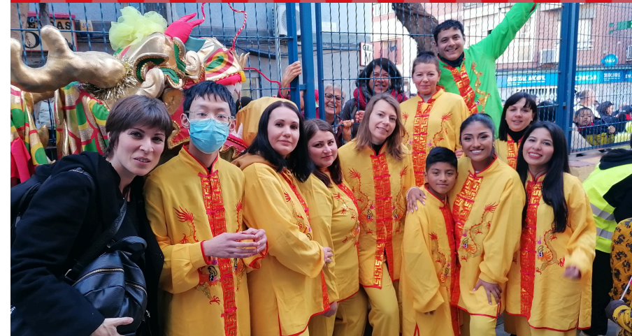
L'alumnat a punt de fer ballar el drac de l'Associació Cultural Popular Xinesa a la rua de cloenda de la Festa dels Fanalets