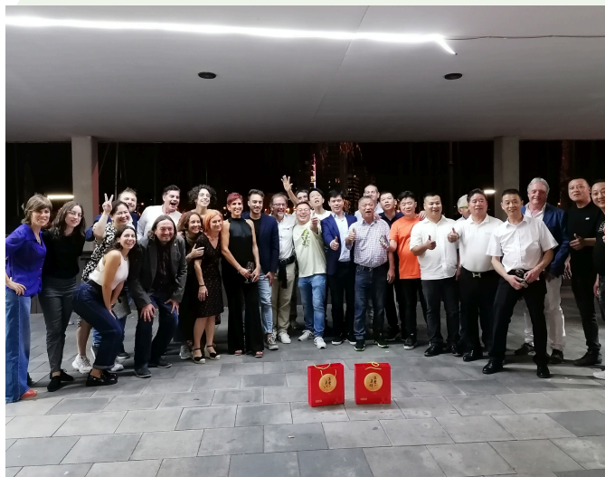
Trobada d'entitats per la Festa de la lluna, Associació de Xinesos a Santa Coloma