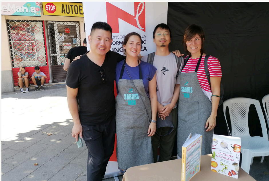
Mostra Sabors del món (plaça del Rellotge)