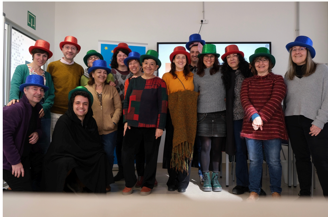
L'equip del CNL L'Heura durant una jornada de treball al Centre de Formació Marie Curie

El CNL té l'encàrrec de portar a terme el pla d'activitats lingüístiques d'acord amb els eixos estratègics del CPNL, que cada any aprova el Ple del CPNL.